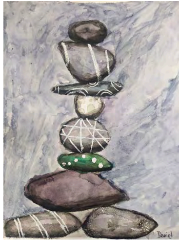
Daniel Montero composición, acrílicos