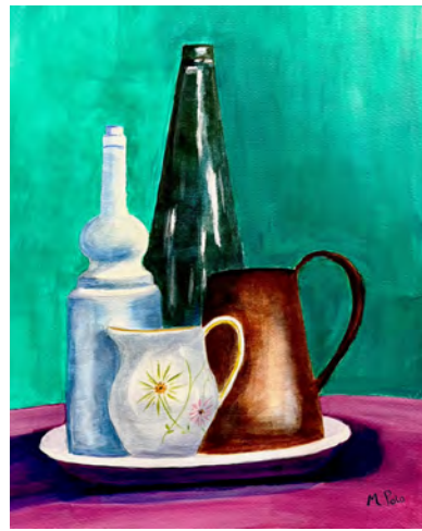
María Isabel Polo composición, acrílicos