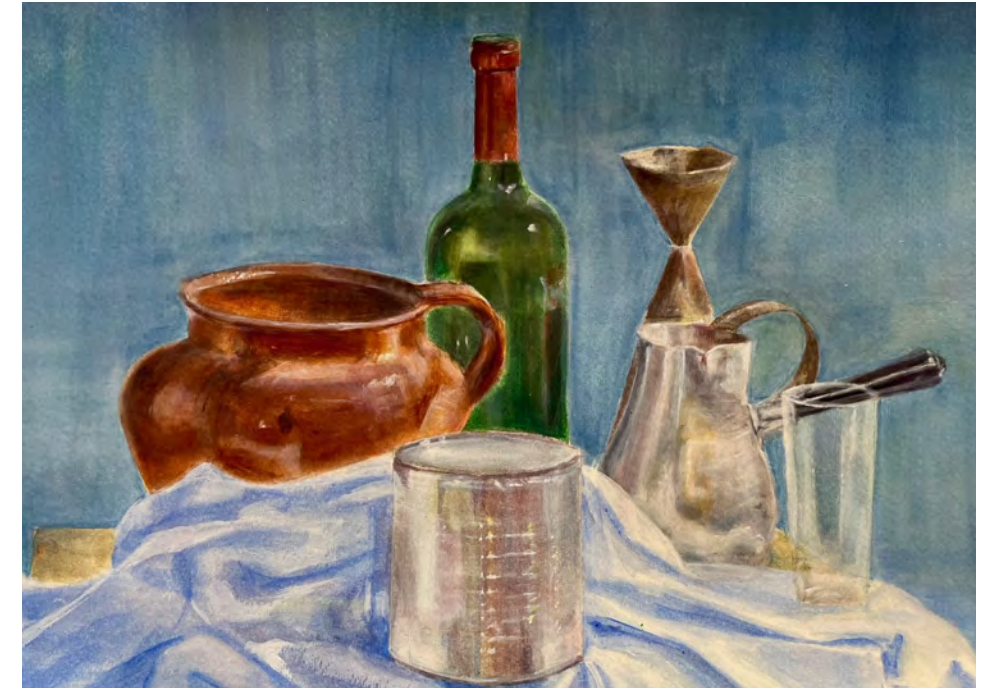
Paula Carrera composición, óleo

Coincidiendo con el inicio de curso 2023-2024, la Escuela de Arte de San Eloy de la Fundación Caja Duero presenta esta muestra en que se exponen una selección de trabajos realizados en sus aulas a lo largo del último periodo académico.