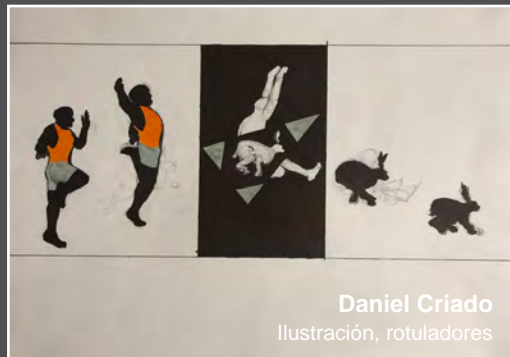
Daniel Criado Ilustración, rotuladores