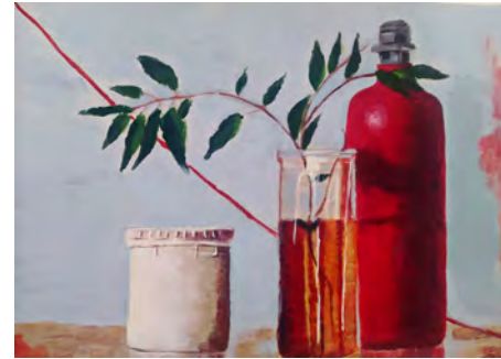
Julia Zamoro composición, acrílicos