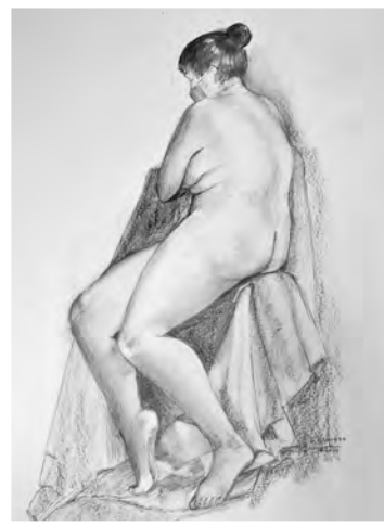
Carmen Vaquero figura sentada, carbón