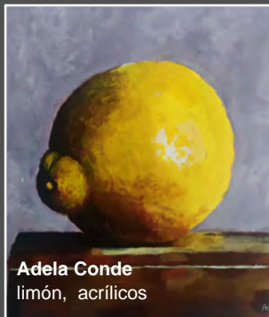
Adela Conde limón, acrílicos