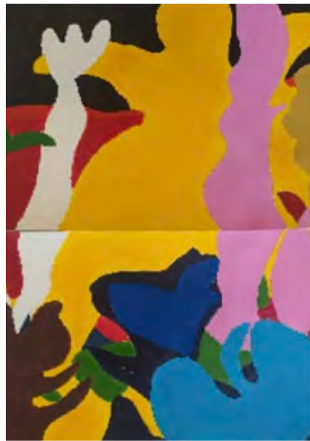
Julia S. García composición, acrílicos