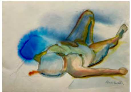
Anabella Esteban Figura echada, técnica mixta