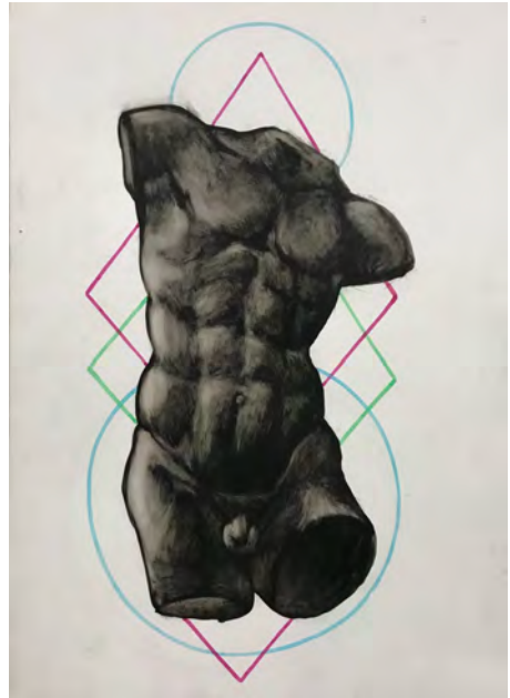
Hugo Iglesias Torso, tintas

La Escuela de Arte de San Eloy de la Fundación Caja Duero, retoma su presencia expositiva con una selección de los trabajos realizados por los alumnos a lo largo del curso 2021-2022.