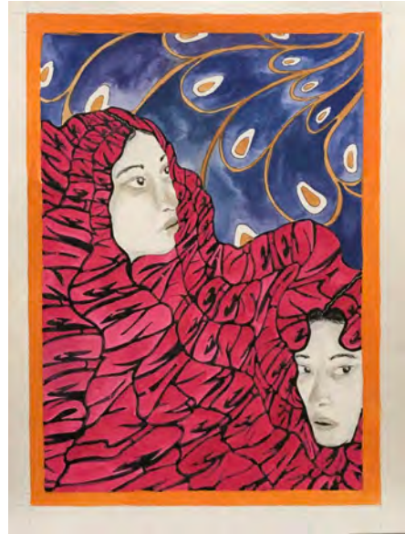
Alba Domínguez Cartel, acuarela