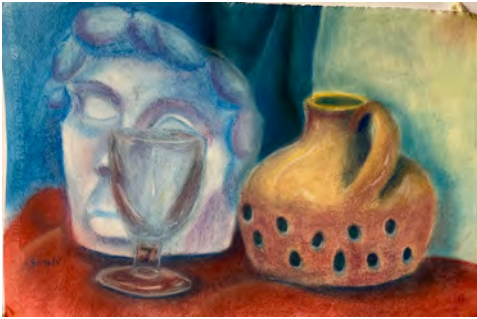
Sintayu Cirera Composición, cretas