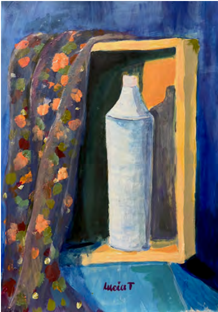
Lucía Teira Composición, acrílicos